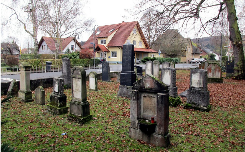
Gesamtansicht des neuen Remagener Judenfriedhofs an der Ecke Alte Straße / Schillerstraße (2015).