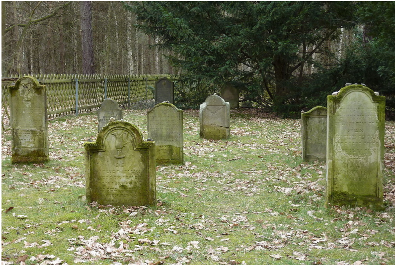
Gräberfeld auf dem Alten Jüdischen Friedhof „Auf der Heide“ in Remagen (2010).