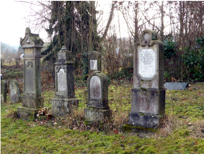
Grabstätten auf dem neuen Jüdischen Friedhof Sinzig, einem Teil des Kommunalfriedhofs (2015)