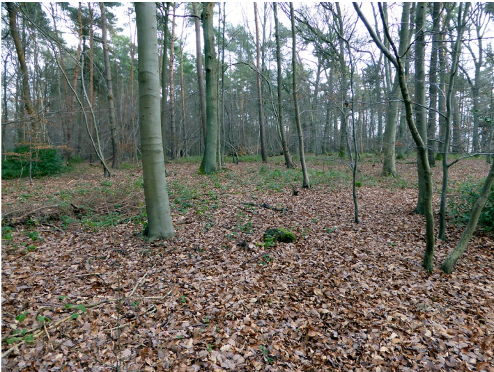
Gelände des alten jüdischen Friedhofs im Wald auf dem Sinziger Mühlenberg (2015)