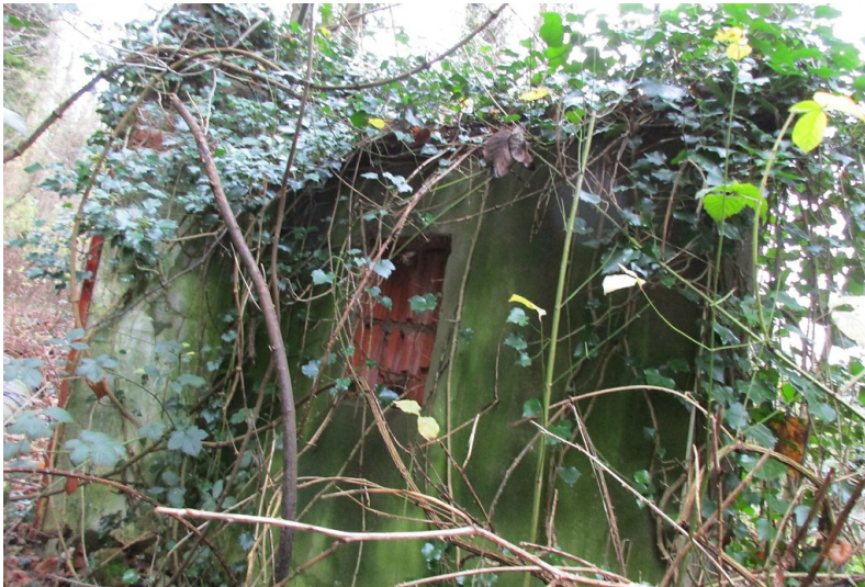
Überwucherte Reste des früheren Eingangsportals zum ehemaligen jüdischen Friedhof "am Kasselbach" in Remagen-Rolandseck (2015).