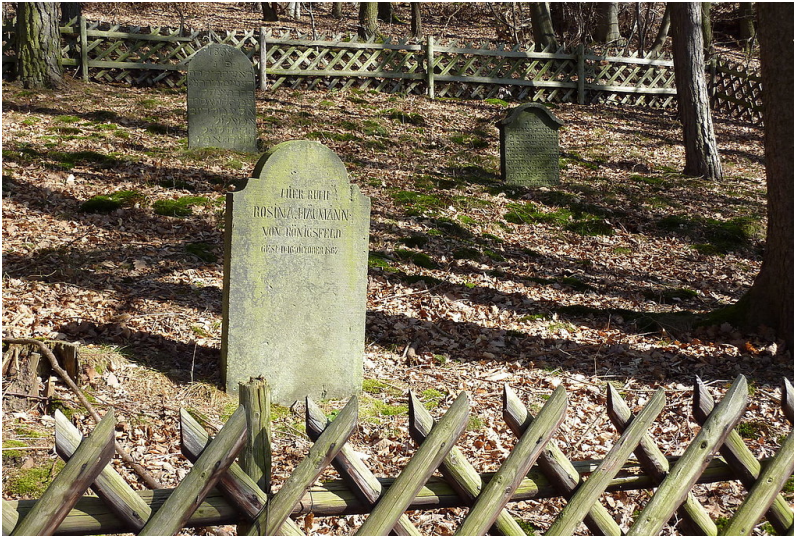
Einzelne Grabsteine auf dem jüdischen Friedhof am Königsbach in Königsfeld, Kreis Ahrweiler (2010).