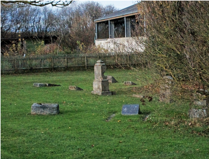
Blick auf das Gräberfeld des neuen Jüdischen Friedhofs Gelsdorf in der Burgstraße (2015).