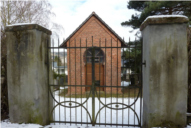
Blick durch die Pforte auf den jüdischen Friedhof auf dem Johannisberg in Bad Neuenahr (2010). Zentral im Bild ist das Taharahaus (Leichenhalle) zu sehen.