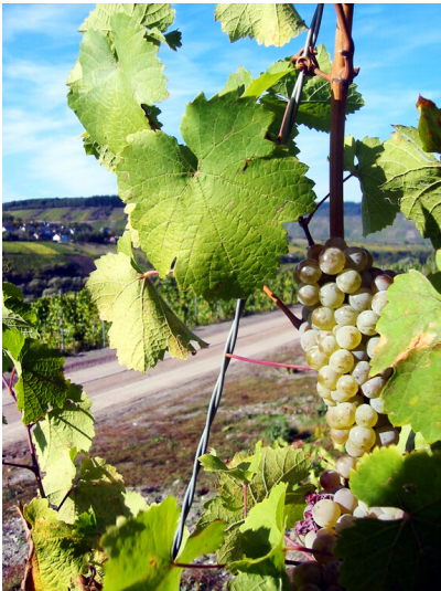
Weinbau an der Mosel: reife Trauben kurz vor der Ernte (2003 bei Traben-Trarbach).