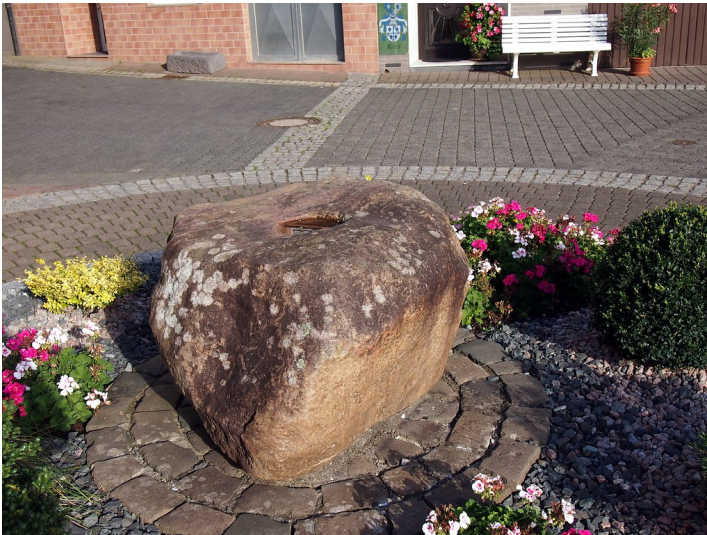
Angelstein des Obertores der Stadtmauer von Zell (2015).