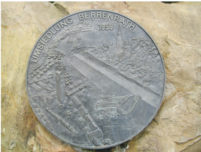
Gedenktafel Umsiedlung Berrenrath (2014)