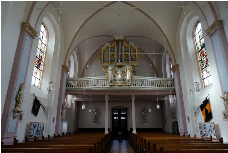
Ansicht des Innenraums der Katholischen Pfarrkirche St. Peter in Zell (2015)