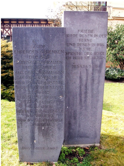
Mahnmal zur Erinnerung an die Geschichte und das Schicksal von Patienten und Mitarbeitern der ehemaligen Jacoby'schen Anstalten in Bendorf-Sayn (2015)