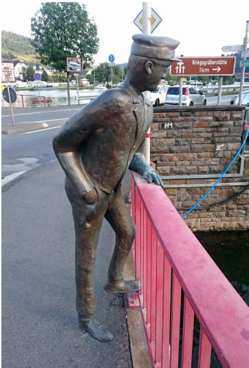
Die 2004 errichtete Figur des Alfer "Bachspouzer" (Bachspucker) an der Stelle der ehemaligen Brücke über den Alfbach in Alf (2016)