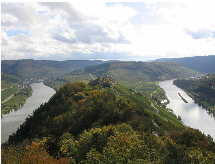
Blick in südöstlicher Richtung über die Moselschleife Zeller Hamm und die Marienburg bei Zell an der Mosel, links im Hintergrund der Ort Merl, rechts im Hintergrund der Ort Briedel.