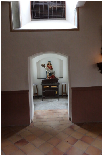
Zugang zur Marienkapelle in Briedel