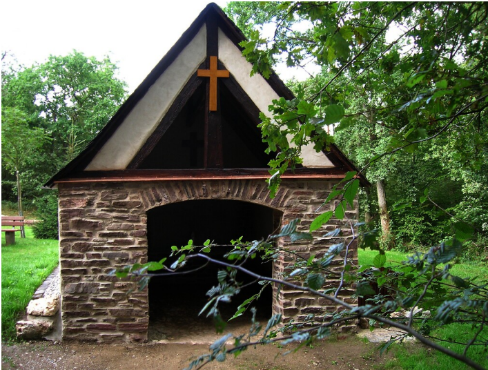
Sündkapelle Briedel