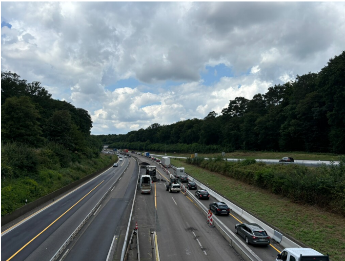
Bundesautobahn 4 (A4) mit Blick von der Autobahnbrücke bei Köln-Brück (2024)