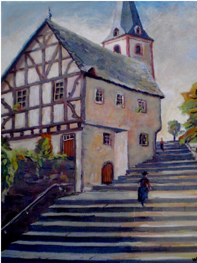
Aquarellbild des alten Pfarrhauses und Schulhauses in Briedel (1920er Jahre).