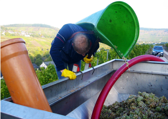
Weinbau und Weinlese an der Mosel: geerntete Trauben werden aus der "Hotte" in den Transportwagen geschüttet (2003 bei Traben-Trarbach).