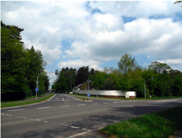
Kreuzung Mauspfad-Lützerathstraße in Rath/Heumar (2015)