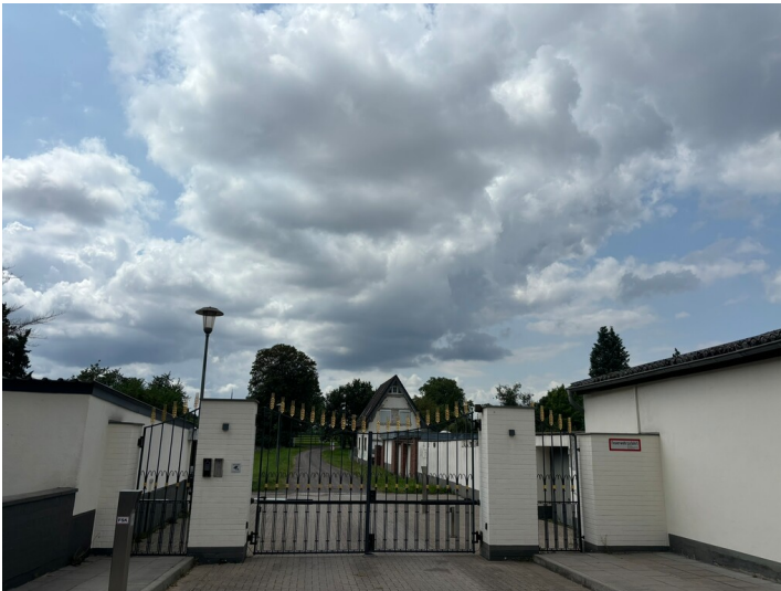
Zugangstor zum Durchhäuserhof in Rath/Heumar (2024)