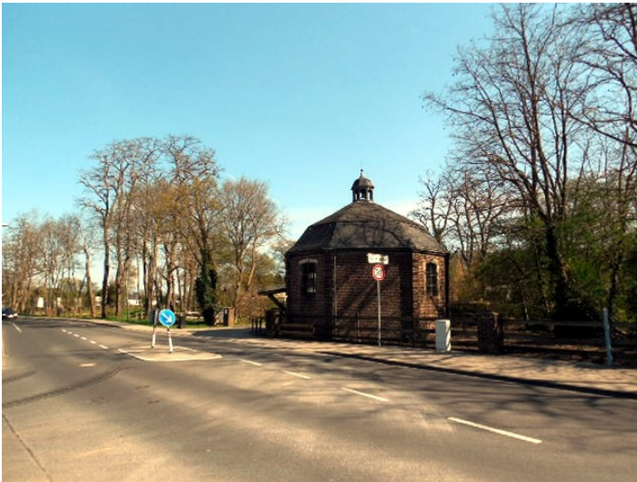
Kapelle der Burg Rath an der Lützerathstraße in Rath (2015)