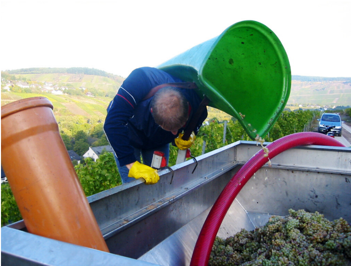
Weinbau und Weinlese an der Mosel: geerntete Trauben werden aus der "Hotte" in den Transportwagen geschüttet (2003 bei Traben-Trarbach).