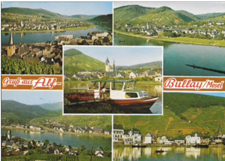
Postkarte aus Alf mit der Moselfähre in der Mitte (gelaufen um 1980)