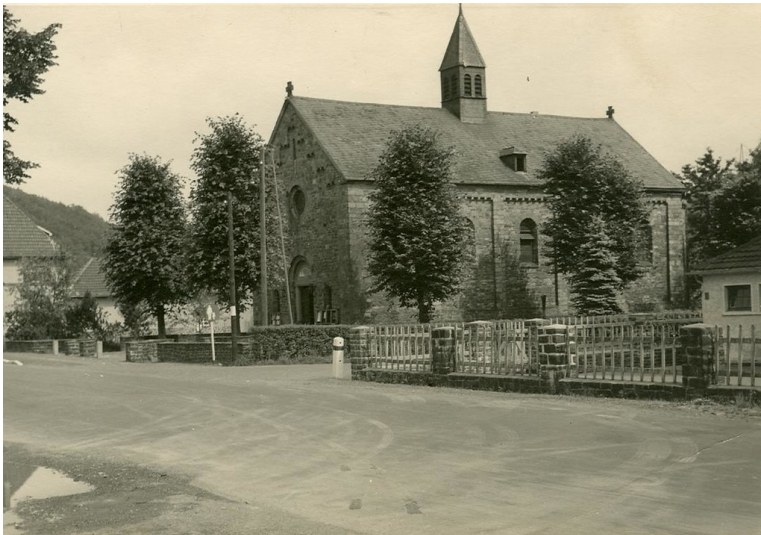
Katholische Herz-Jesu-Kirche in Loope (um 1910)