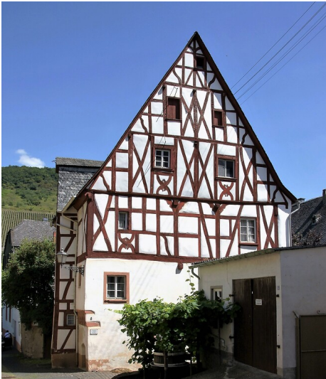
Das Hofhaus Sponheim in der Himmeroder Strasse in Briedel an der Mosel (2009)