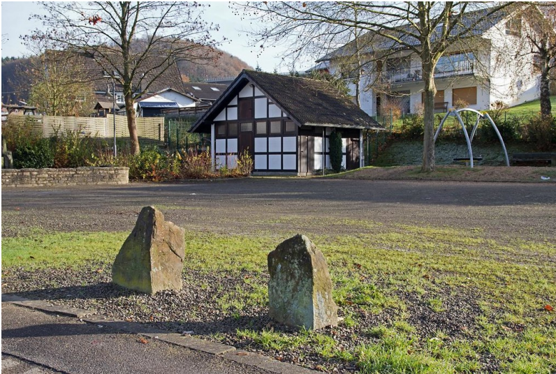
Looper Dorfplatz (2013)