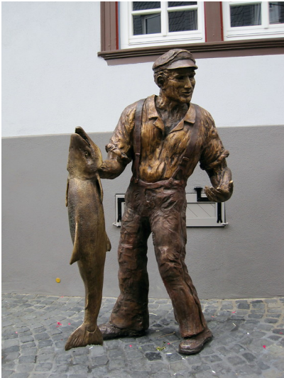
Das Bronzestandbild Ernst der Salmfischer der Künstlerin Jutta Reiss, Symbol für die Salmfischerei in Sankt Goarshausen (2012) Fotograf/Urheber: Haffitt