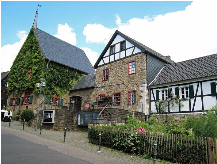
Bergisches Museum für Bergbau, Handwerk und Gewerbe in Bensberg (2016).