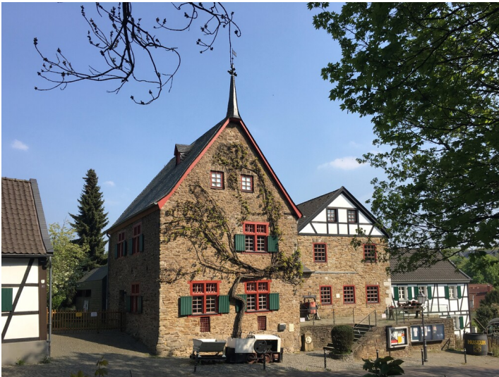
Bergisches Museum für Bergbau, Handwerk und Gewerbe in Bensberg (2020).