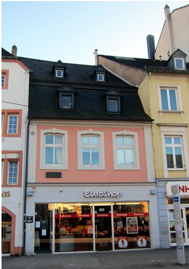
Wohnhaus der Familie des deutschen Philosophen Karl Marx (1818-1883) in der Trierer Simeonstraße (2014). Die Familie Marx lebte hier von 1819 bis um 1850, der spätere Theoretiker des Sozialismus und Kommunismus bis 1835.