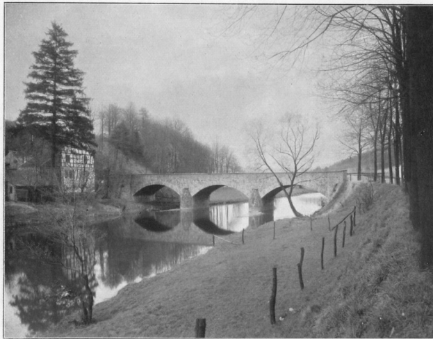
Abb. 9. Aggerbrücke bei Loope (Kreis Wipperfürth).