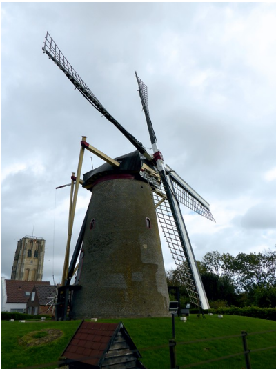
Windmühle De Windvang in Goedereede, Süd-Holland (2017), Ansicht von Norden.