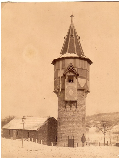
Historische Aufnahme: Der Wasserturm im Bahnhof in Münstereifel um 1910.