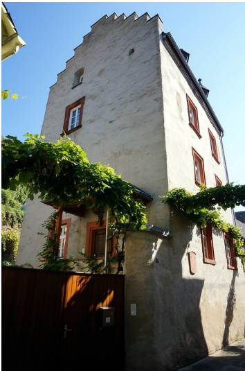
Wohnturm in der Zandtstraße in Zell-Merl (2015)