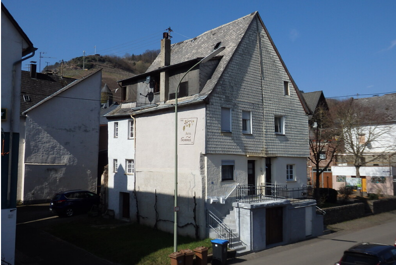
Blick auf das Doppelhaus Moselstraße 28/29 in Briedel (2020)