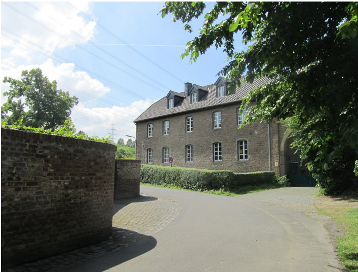
Ehemalige Remise, heutiges Forsthaus (Äbtissinenhaus) Kloster Burbach (2014)