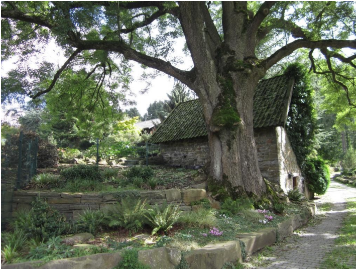
Blick auf eine alte Esche mit Vorratskeller in Abstoß (2013)