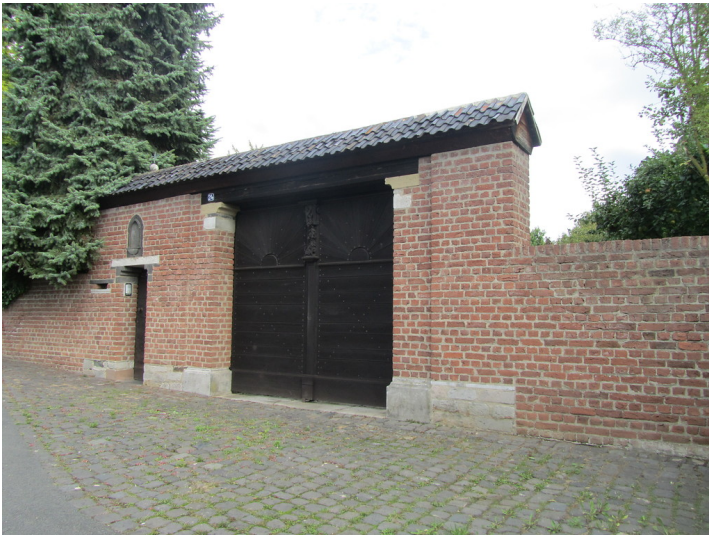
Mauer des Pfarrhofes in Brühl-Badorf (2014)