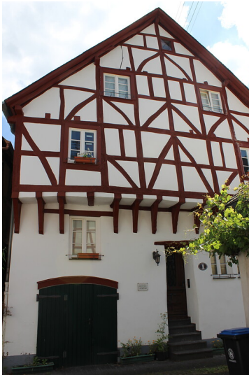
Fachwerkhaus Alte Rathausstraße 1 in Briedel (2005).