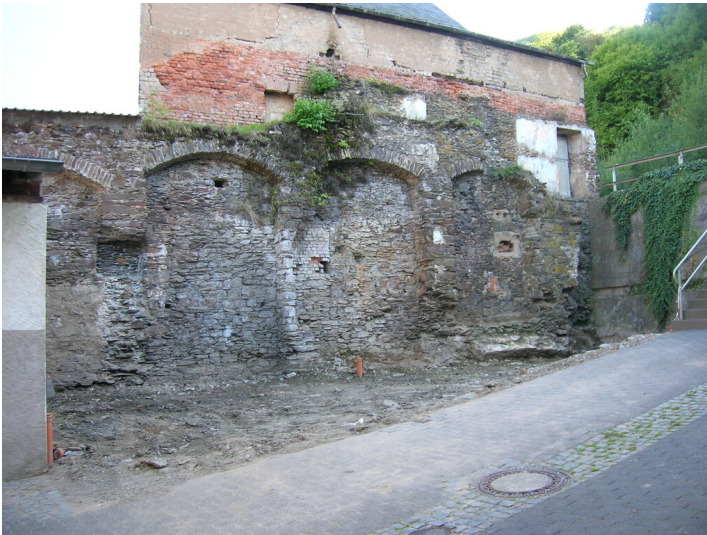
Briedeler Ringmauer (2006)