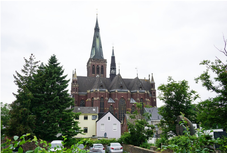
Viersen-Dülken, historischer Ortskern (2021). St. Cornelius von Norden.