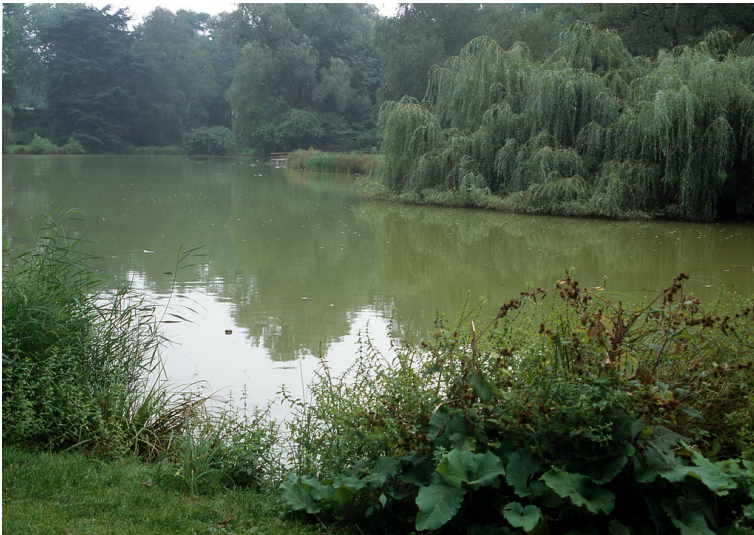
Köln-Klettenberg, Klettenbergpark, Siebengebirgsallee / Luxemburger Straße (2006)