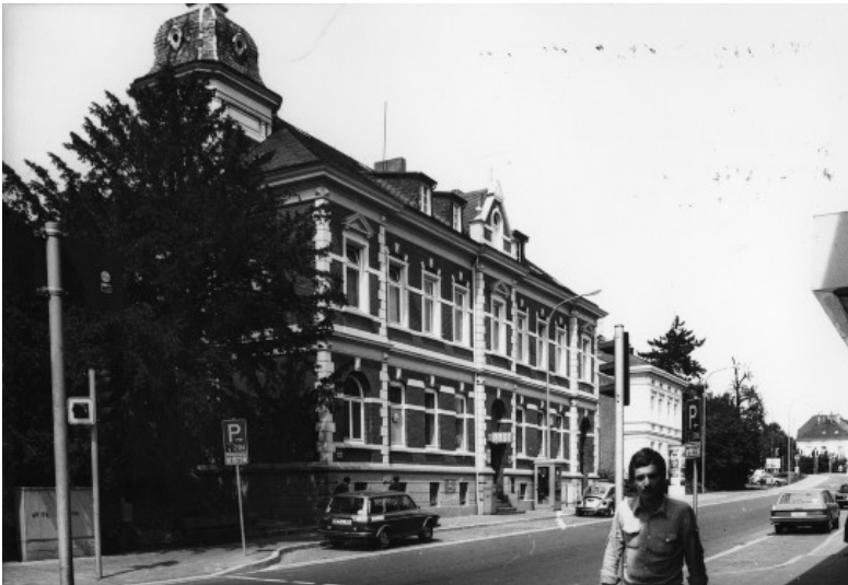
Postamt Wülfrath, Wilhemstraße 82 (1978)