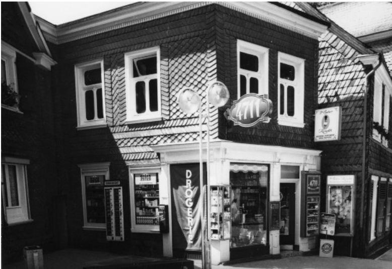
Wohn- und Geschäftshaus Anker, Wilhelmstraße 157 in Wülfrath (1978)