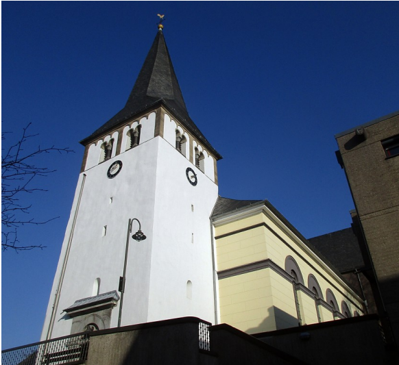
Kirchturm und Gebäude der Pfarrkirche St. Johannes in Sieglar (2017).