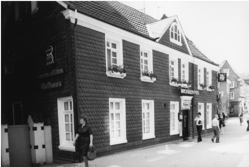
Wohnhaus und Gaststätte Metzenhaus, Wilhelmstraße 161 in Wülfrath (1978)