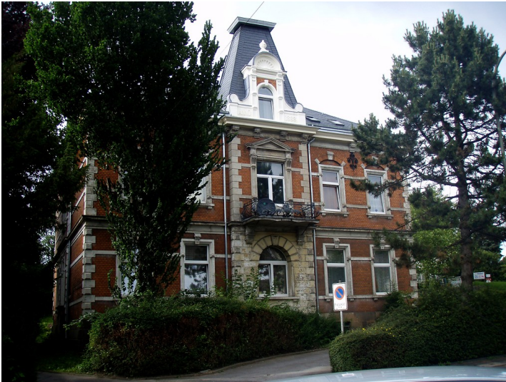
Wülfrath-Wülfrath, Wilhelmstraße 76, Verwaltungsgebäude (2009)