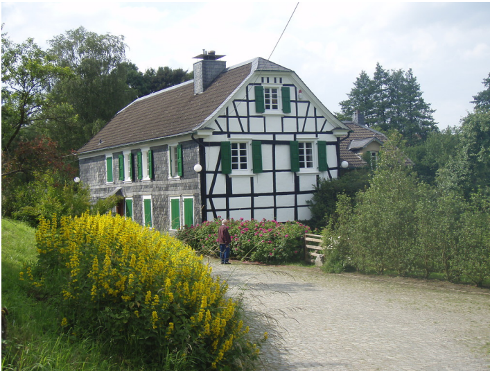
Wülfrath-Wülfrath, Hahnenfurther Weg 30, Gut Schlingensiepen (2009)